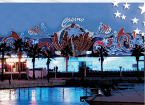
A L I C A N T E