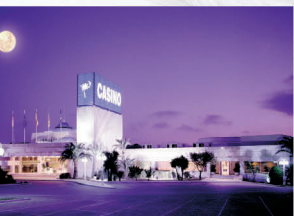
V I L L A J O Y O S A